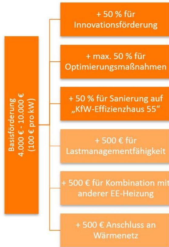
Abbildung 2: Zusammensetzung der Marktanzreizprogramm-Zuschüsse im Bestandsgebäude, Stand August 2018.

Weitere Boni sind für die Lastmanagementfähigkeit, die Kombination mit anderen Erneuerbaren Energien und eine besondere Gebäudeeffizienz verfügbar. Informationen werden auf der Seite des Bundesamtes für Wirtschaft und Ausfuhrkontrolle (BAFA) unter www.bafa.de zur Verfügung gestellt.